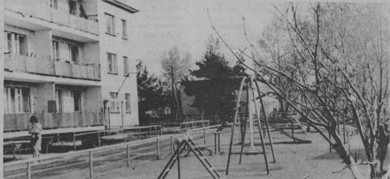
На снимке: дворик у дома на центральной усадьбе.

Эту заботу нельзя не заметить. В каждом отделении хозяйства можно увидеть новые жилые дома, новостройки. В совхозе есть многоэтажные дома городского типа, но в последнее время сельский житель тяготеет к индивидуальному дому. Это учли. Сейчас в Черемховском, Черноусовском, Беловодском, Позарихинском отделениях строятся для рабочих кот-