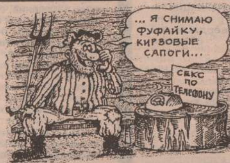
Рисунок К. Мальцева.