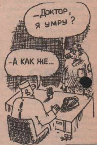
Рис. В. Федорова.

...БРОНХИТ И ДЛИТЕЛЬНЫЙ КАШЕЛЬ: смешайте 100 г свиного или гусиного смальца, 100 г несоленого сливочного масла, 100 г пчелиного меда. Добавьте столовую ложку свежего сока алоэ и около 50 г какао (для вкуса, но можно и без него), и все хорошо перемешайте. Взрослым - под одной столовой ложке, детям - по одной чайной или десертной ложке на стакан горячего молока.