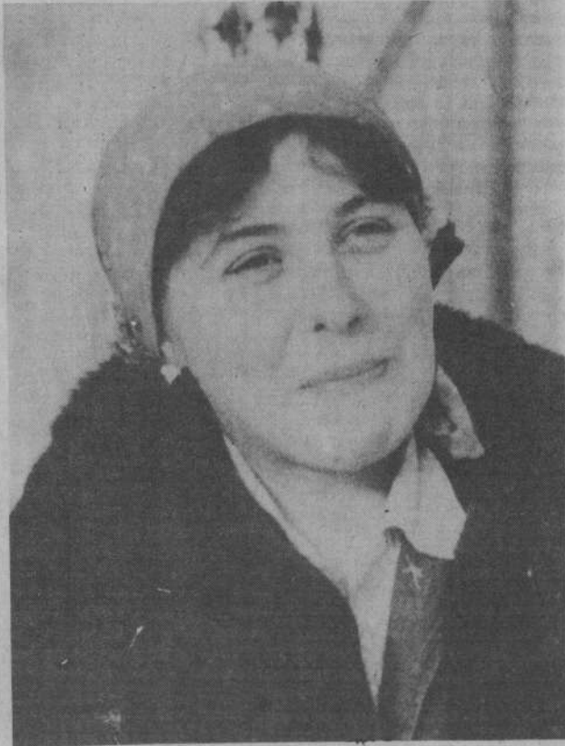
В КОЛЛЕКТИВЕ — ОДНА ИЗ ЛУЧШИХ

М. ЗАВЬЯЛОВА, наш внештатный корреспондент.