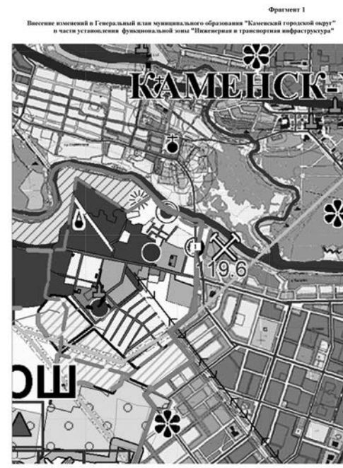
1 - мост через реку Исеть с транспортно-пешеходными подходами