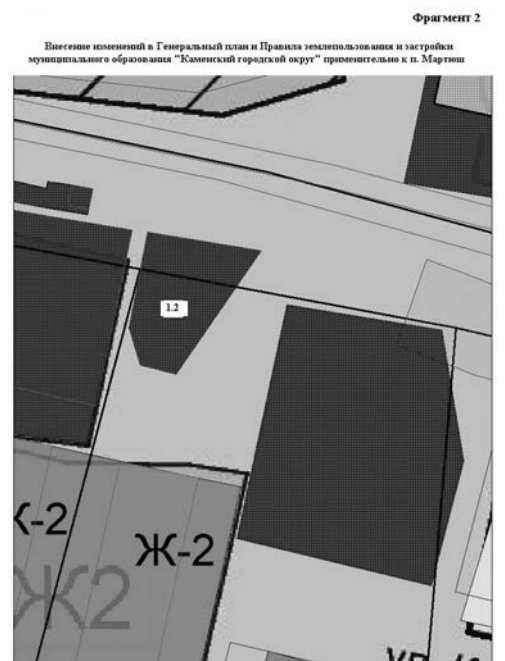
1.2 - земельный участок ул. Гагарина, 1е/1 (изменение зоны ИТ4 на зону ОД1)