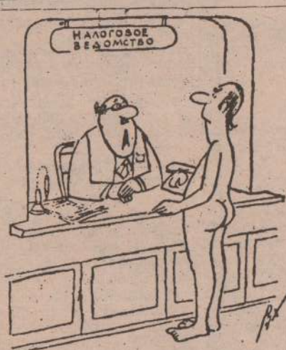
— А чем вы докажете, что наш сотрудник у вас уже был?