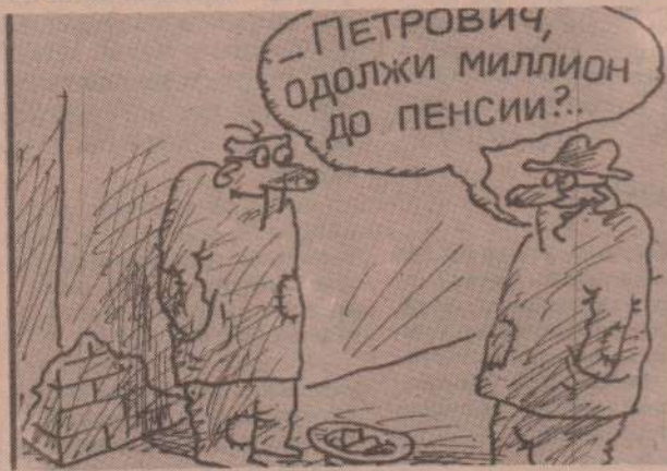
Рисунок В. Федорова.