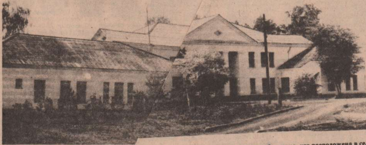
Центральная районная больница, что расположена в селе Покровском, основана в 1960 году. Тридцать лет врачи и медсестры заботятся о здоровье наших земляков.