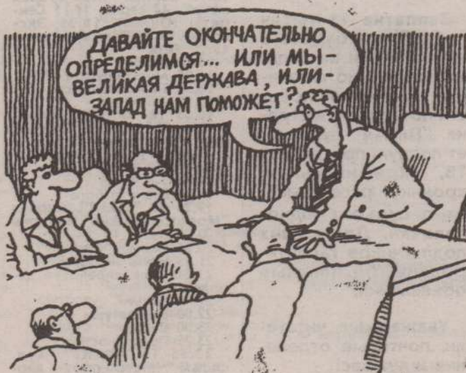
Рис. В. НЕНАШЕВА.

- Формирование документов будет проходить на местах - в управлении соцзащиты, затем их направят по инстанции - в главное управление социальной защиты области, а оттуда, после рассмотрения они поступят в Минсоцзащиты. Для оценки правильности, достоверности и полноты сведений Российский Фонд взаимопомощи и примирения проведет экспертизу и вынесет свое заключение. И только после этого уполномоченными банками и через систему отделений Сбербанка граждане получат возмещение либо в валюте, либо в рублях, обмененных по курсу (это зависит от желания получателя).