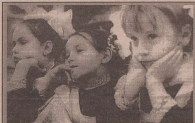
Наше будущее нуждается в защите

В Клевакинском детском саду открыта группа круглосуточного пребывания для малышей из неблагополучных малообеспеченных семей. Традиционно выпускникам детских садов вручаются бесплатные подарки; наборы сладостей и фруктов получают все ребятишки дошколята на Новый год.