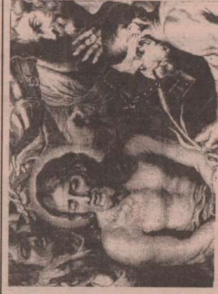
Ван Дейк. "Поругание Христа" (фрагмент)