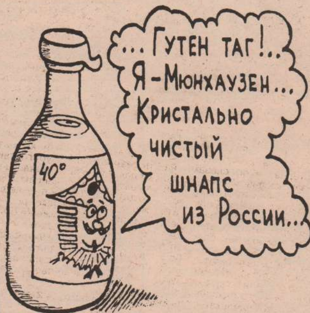
Рисунок В. Жабского.