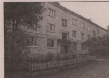
их установят для жильцов домов-победителей.

Главным призом конкурса «Образцовый дом» стали детские спортивно-игровые комплексы. В ближайшее время