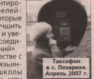
Таксофон в с. Позарихе. Апрель 2007 г.

В сотрудничестве с ОАО «Уралсвязьинформ» все школы подключены к сети Интернет. А компания «Мотив» в некоторых деревнях установила телефонные вышки. Селяне охотно пользуются услугами этого оператора.