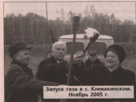
Запуск газа в с. Клевакинском. Ноябрь 2005 г.

С 2004 по 2007 год было смонтировано 5,1 км межпоселковых газопроводов и 24,13 км уличных газовых сетей. Газифицировано 236 квартир. Затраты на эти