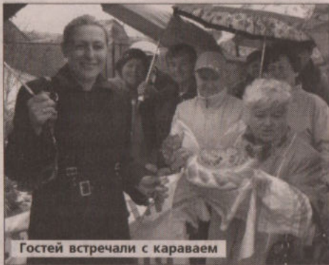
Гостей встречали с караваем

А подкрепиться и набраться сил можно было здесь же. Гости радовали богатые торговые ряды. Чего тут только не было! Пирог, сладости, сочный шашлык, горячий чай... Любимой жеманной могли найти себе лакомство по душе.