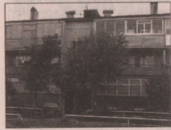
Первое место в нем занял дом № 5 по улице Механизаторов в с. Позарихе. Старшая