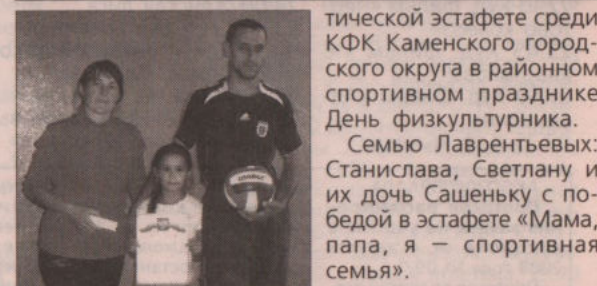
Клевакинская сельская администрация