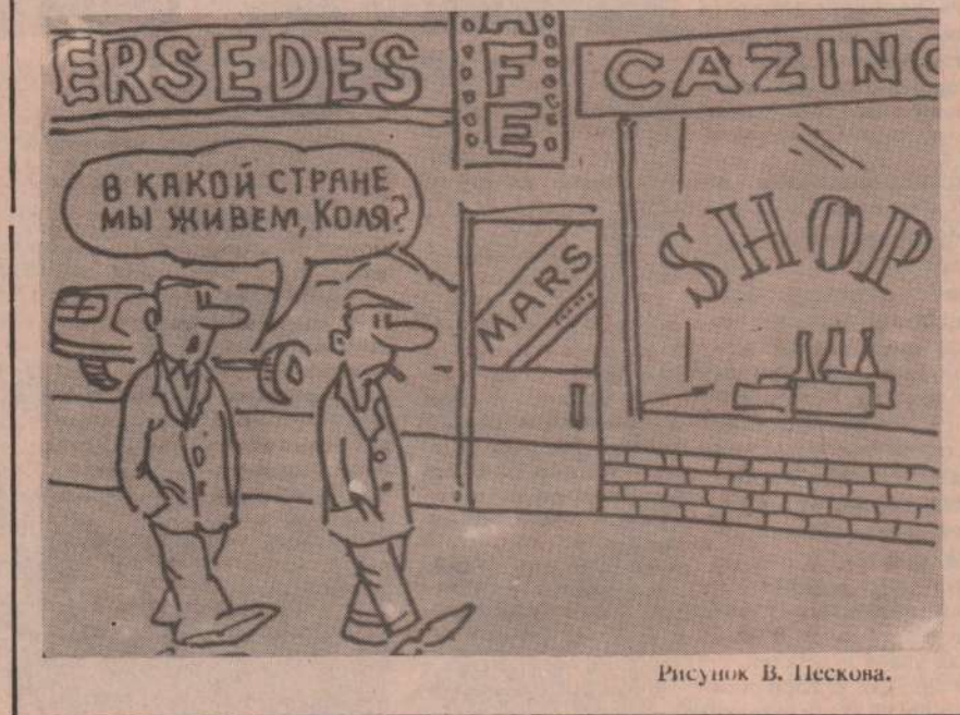
Рисунок В. Пескова.