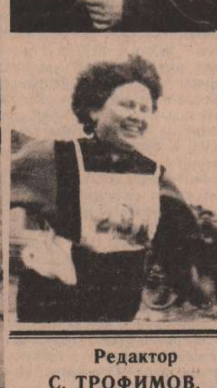
Редактор С. ТРОФИМОВ.

АДРЕС РЕДАКЦИИ: 623409, г. Каменск-Уральский, ул. Ленина, 117 (второй этаж) ТЕЛЕФОНЫ: редактор 3-63-06, зам. редактора и отдел партийной жизни 3-50-58, отв. секретарь 3-42-19, отдел социальных проблем 3-16-69, агропромышленный отдел 3-54-29, отдел писем, культуры и быта 3-43-60, фотокорреспондент и бухгалтер 3-56-12, корректор 3-02-29.