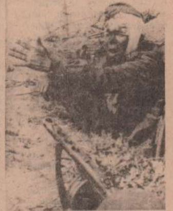
Политрук продолжит бой.