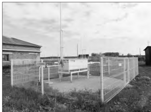
Газ в селе – комфорт для жителей

P.S. Когда верстался номер, стало известно, что на газификацию Колчедана выделено в этом году 3 млн 259 тыс. руб. Как и планировалось, работы по строительству нитки начнутся в августе 2019 г., а закончатся в 2020 г. В зону газопровода длиной 4,5 км попадут шесть улиц и один переулок. Принято решение и в отношении жителей Брода, на строительство газопровода длиной 4 км в этом населенном пункте выделено 7 млн 066 тыс. руб.