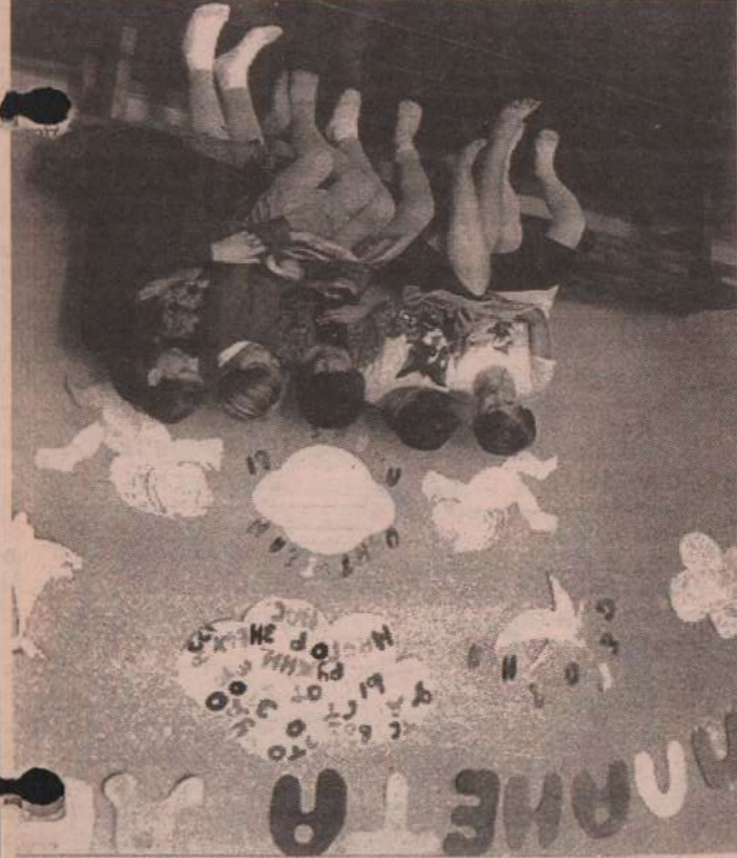
А. ВИКЕ.