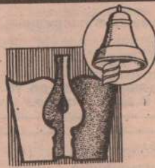
Редактор С. Трофимов