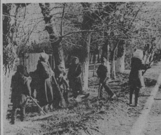
ГОТОВИМСЯ К ПРАЗДНИКУ