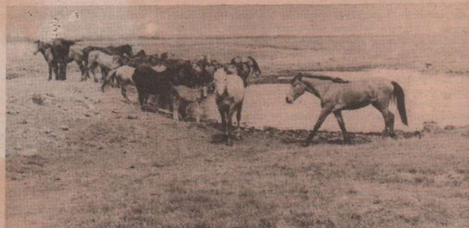
Ходят кони к водопою...