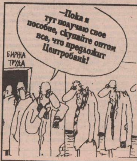
рис. В. Шилова (С.-Петербург).

В четвертом квартале по сравнению с предыдущим число сельчан, имеющих право на получение адресной помощи, сократилось с 5228 до 4350 человек. Повлияло увеличение размеров минимальной оплаты труда и минимальной пенсии.