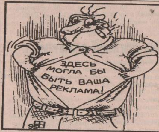
рис. В. Федорова (Челябинск).

Наши сотрудники окажут помощь в подборе товара, учитывая особенности вашего производства.