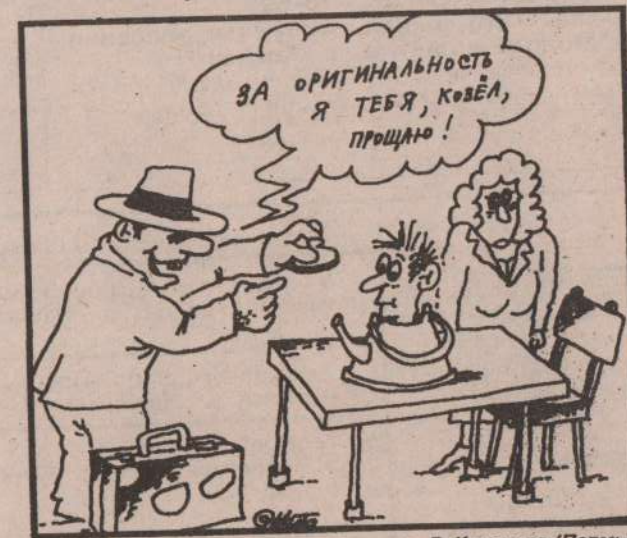
рис. Д. Кононова (Пермь).

по материалам газеты «Каменский рабочий».