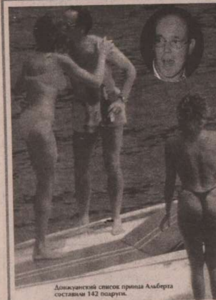
Донжуанский список принца Альберта составлен 142 парами.