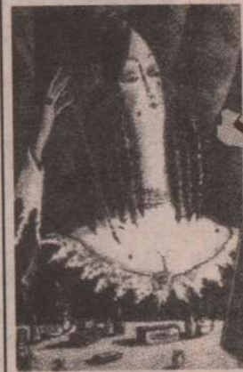
ДЖОН ДОНН (1572—1631)

Закон есть закон, и перед ним все равны. Именно дети по закону являются наследниками первой очереди. Они имеют право наследовать имущество своего отца и могут претендовать на долю приватизированной квартиры так же, как и вы.