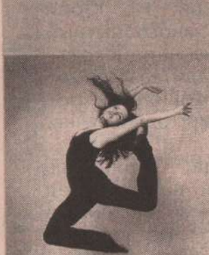
Завораживающая грация движения.