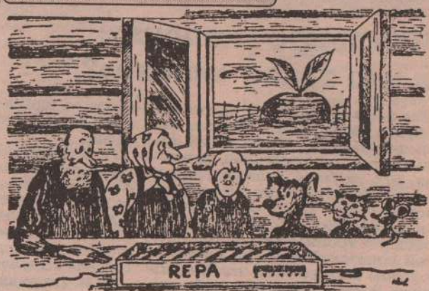
Рис. Н. КИНЧАРОВА (Волгоград).