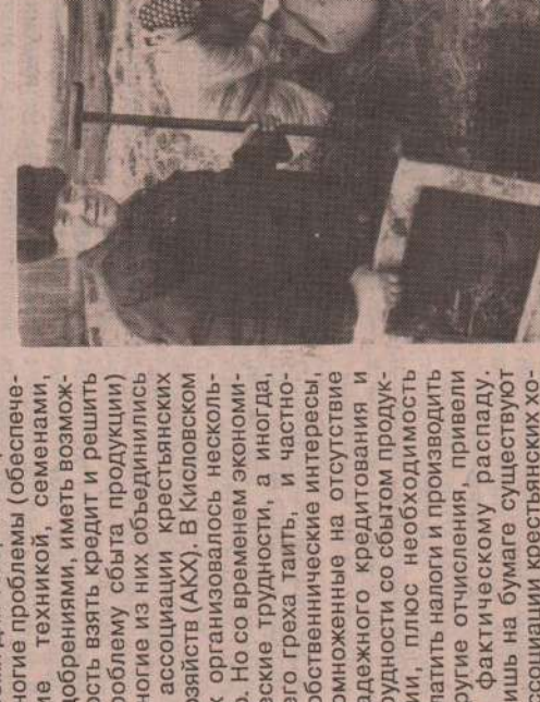
На снимке: проверка качества кормов.

щества и производственные кооперативы, еще кое-как сводят концы с концами, то фермерам сегодня приходится ся намного труднее. Например, в том же селе Кисловском в свое время создавалось несколько крестьянских (фермерских) хо- зяйств. Спустя некоторое время для того, чтобы решать многие проблемы (обеспече- ние техникой, семенами, удобрениями, иметь возмож- ность взять кредит и решить проблему сбыта продукции) многие из них объединились в ассоциацию крестьянских хозяйств (АКХ). В Кисловском же организовалось несколь- ко. Но со временем эконо- мические трудности, а иногда, чего греха таить, и частно- собственные интересы, помноженные на отсутствие необходимого кредитования и трудности со сбытом продук- ции, плюс необходимость платить налоги и производить других хозяйств как в Камельском районе, так и в Уральском регионе, и привели к фактическому распаду. Лишь на бумаге существуют ассоциации крестьянских хо-