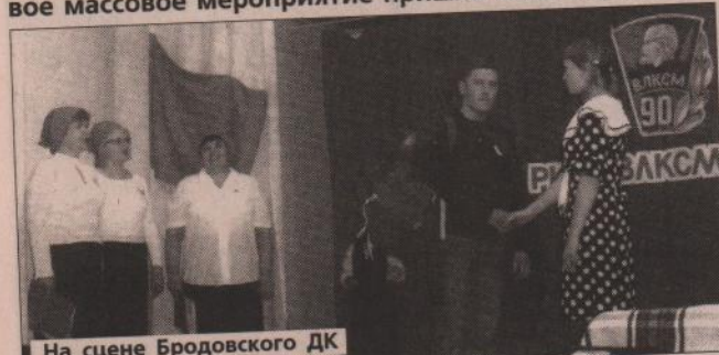
На сцене Бродовского ДК

Долгое время клуб в деревне Брод не работал из-за ремонта. Сельчане все ждали, когда же он откроется. Люди соскучились по общению, поэтому на первое массовое мероприятие пришли много зрителей.