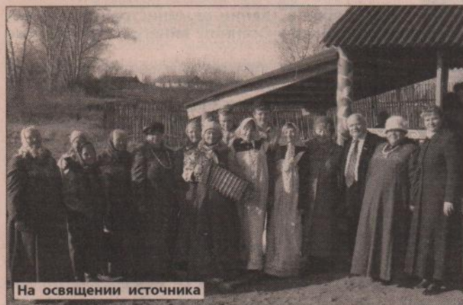
На освящении источника

24 октября в д. Большой Грязнухе прошло освящение родника «Катанят». Обряд проводил отец Алексей.