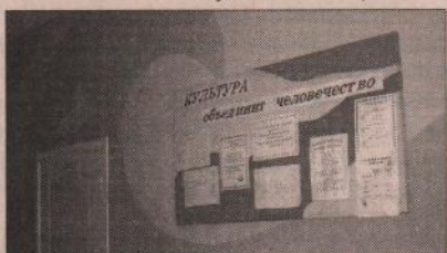
В фойе Покровского и Маминского ДК

В процесс ремонтных работ входило и выполнение предписаний Госпожнадзора, которым было уделено серьезное внимание. На устранение нарушений обязательных