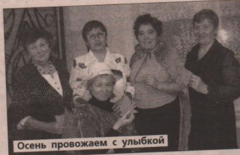
Осень провожаем с улыбкой