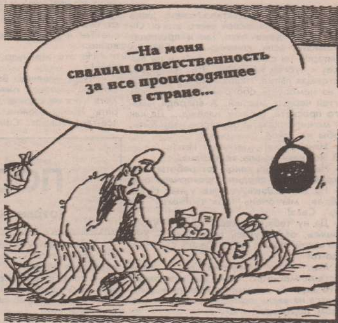
Рис. В. ШИЛОВА.

По мнению парламентариев, проект "чубайсовского" указа угрожает разрушением существующей ныне системе образования, ибо предоставляет правительству РФ право преобразовывать государственные гражданские высшие и средние профессиональные учебные заведения страны в частные. А что еще может означать фраза "в учреждения, осуществляющие свою деятельность на принципах автономии и демократического самоуправления и многоучредительства"? Тем более, что прочие положения данного документа не устраняют главной цели авторов проекта указа - добиться разгосударствления, то есть приватизации образовательных учреждений. Их предложения - худший вариант, не учитывающий традиций России и мирового опыта. Разработка проекта, сказано в Обращении, идет в обход действующего законодательства.