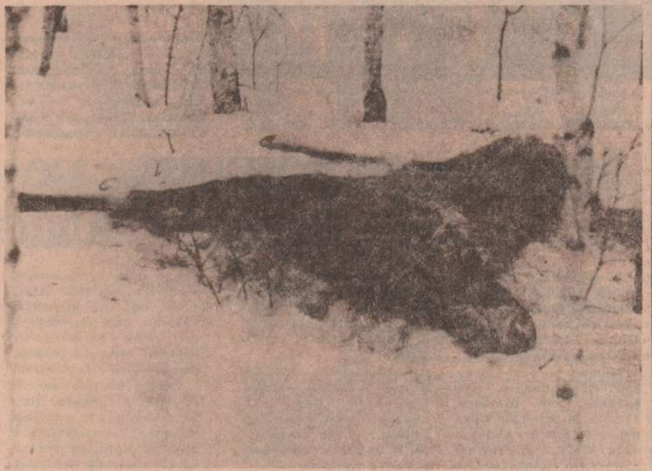
Они все так же верят в нас и ждут от нас помощи. Им сейчас труднее, чем нам. И наш долг — помочь животным. А то, может получиться так, что, выйдя из полосы неурядиц, мы уже не обнаружим наших лесных обитателей.

Да, мы очерствели и ожесточились. Неурядицы в стране больно бьют по каждому из нас. Многие, наверное, вообще скажут: да что там лось, когда и цена-то человеческой жизни сейчас невысока. Да, времена трудные. Но мы — люди. Доброта и сострадание свойственны характеру человека. И не лесные наши братья повинны в нашем разладе.