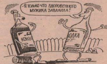
Рис. Л. ЧЕРНЫХ.

Прапорщик - солдатам. «Во время атомного взрыва оружие держать на вытянутых руках, чтобы расплавленный металл не закапал казенное обмундирование».