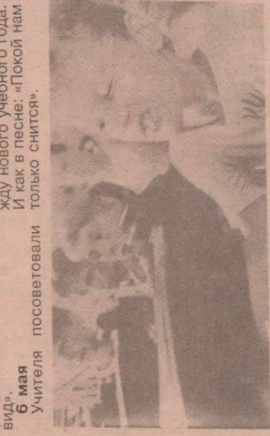
6 мая Учитель посоветовали

Многие эстрадные знаменитости переживают. Куда? Леонид Агутин сидел из обычного двухкомнатной квартиры конфет-ку. Он снес стенку мебели и в конце осени отметил новоселье. Справил новоселье и семейство Пугачевых-Киркоровых . Семья перебралась в двухэтажные апартаменты в районе Курского вокзала. В общем, семейное гнездо А.Б.П. и Ф.Б.К. вполне соответствует удельному весу звезд на отечественной эстраде.