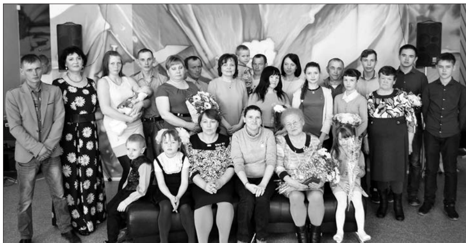
Фотографии размещены в социальной сети «Одноклассники» в группе «Газета «Пламя» КГО» ( https://www.ok.ru/gazetaplama ).

Уважаемые читатели, ФГУП «Почта России» утвердила стоимость доставки газет на II полугодие 2017 г.: