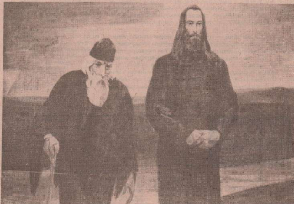
На картине: «СЕРГИЙ РАДОНЕЖСКИЙ И АНДРЕЙ РУБЛЕВ».