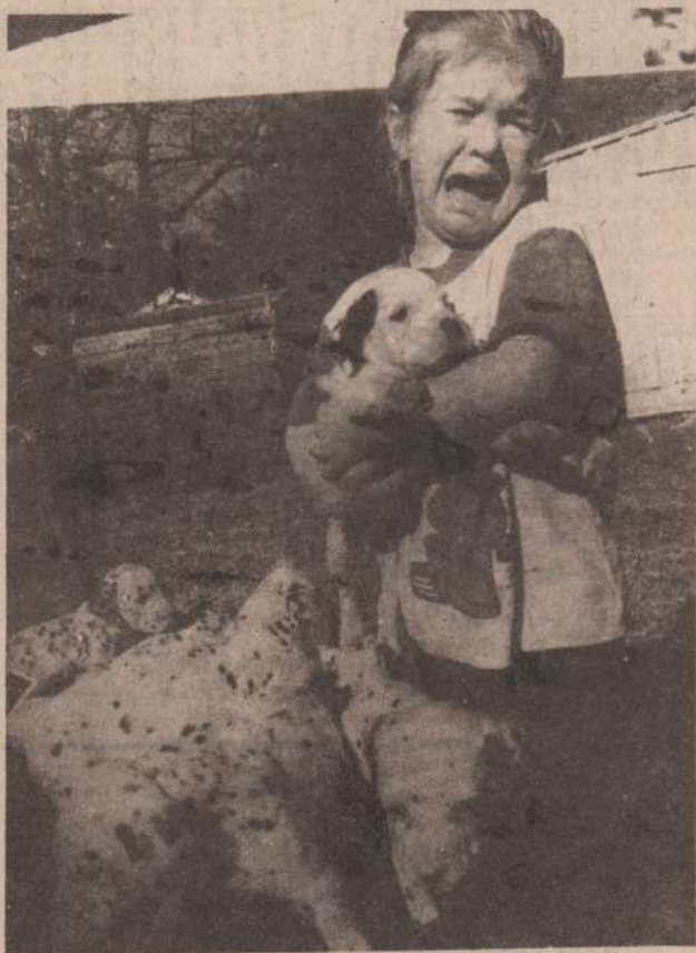
Никогда его не брошу, потому что он хороший