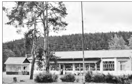
Лагерь «Колосок» готовится к приему ребят

В Каменском городском округе на оздоровление и отдых детей в этом году будет затрачено 13 604 287 руб., в том числе 7 млн 441 тыс. руб. по соглашению между министерством образования региона и МО «Каменский городской округ» предусмотрено выделить из областного бюджета. Это позволит оздоровить 2434 сельских ребят.