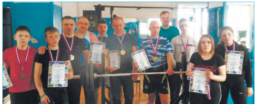
На соревнованиях собрались самые сильные люди в районе