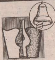
Редактор С. Трофимов