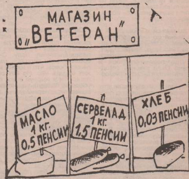
Рисунок В. Жабского.