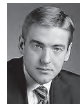
Виктор Евтухов, заместитель министра промышленности и торговли РФ:

Бренд «UVZShop», созданный гигантом военной и транспортной промышленности – корпорацией «Уралвагонзавод», – показательный пример качественного российского продукта, и ярким событием стало создание собственного бренда одежды, обуви и аксессуаров.