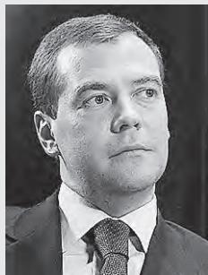
Дмитрий Медведев, председатель Правительства РФ:

«Промышленная направленность ИННОПРОМа по-особому отличает это мероприятие, поэтому нами принято решение присвоить ему статус федеральной выставки».