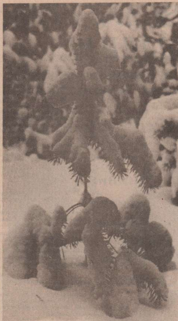
Ровно две недели осталось до конца зимы. И хотя февраль оказался на удивление теплым, никто не отважится с уверенностью утверждать, что впереди нас не ждут суровые морозы. А лес по-прежнему стоит, белоснежным нарядом своим радуя всех, кто любит проводить на лыжах свободное время, любит отыскивать скрытые от праздного взгляда неожиданные узоры русской зимы.

А еще хочется поблагодарить комсомола Пироговского совхоза. Ребята провели благотворительную лотерею и вырученные деньги (115 рублей) передали нашему детскому саду. Коллектив «Ивушки».