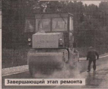
Завершающий этап ремонта