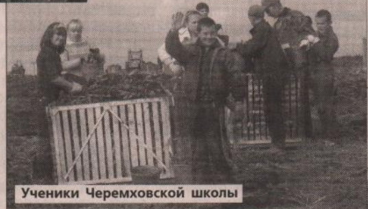
Ученики Черемховской школы

На поле с морковью все того же ОАО «Каменское» совсем другая картина: здесь нет шума машин, но слышится смех ребят. На уборке моркови задействованы ученики 7-8-х классов Черемховской школы.