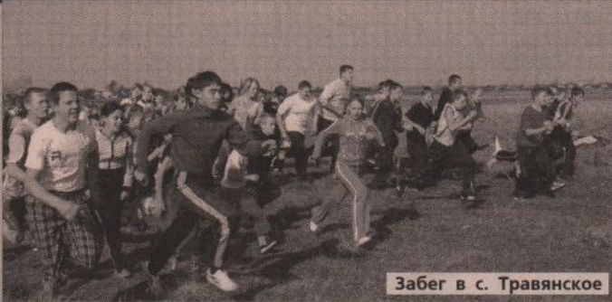
Забег в с. Травянское

Популярность кроссов стремительно растет. Помимо чисто соревновательной стороны, они становятся одним из основных средств физической