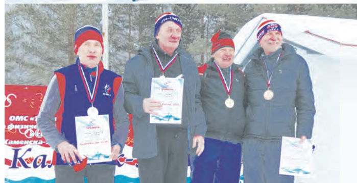
Ветераны на пьедестале почета

шие на массовый старт, который не предполагал гонки на результат. Прогуляться в прекрасную погоду на лыжах – уже удовольствие! Отдельно соревновались школьники до 10 лет, ученики старших классов, ветераны. Свои силы смогли проверить и спортсмены, представляющие разные спортивные секции.