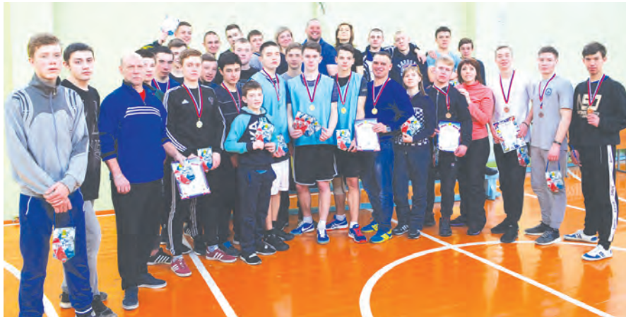
В соревнованиях приняли участие восемь команд