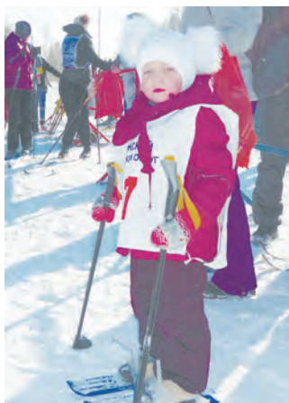
Самая младшая участница забега

В этом году соревнование проходило в пять этапов. Свою приверженность здоровому образу жизни показали руководители – представители администрации и главы территорий, директора предприятий и организаций. Их поддержали участники, вышед-