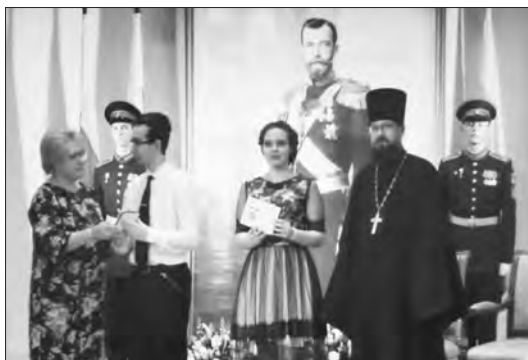
Ученица Новоисетской школы награждена медалью «Преуспевающему»

Накануне события его участники прибыли в Екатеринбург для подготовки: принимали участие в экскурсиях, беседах,