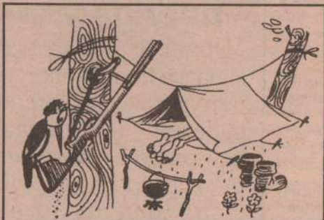
Когда охотник спит. Рисунок О. Марковича

В черте города появилась куница, белка же начала исчезать. Причин несколько: во-первых, куница-хищник; во-вторых, прошлогодний неурожай шишек; в третьих, белка перестала бояться и этим пользуются мальчишки - стреляют, гоняют. И если мы хотим, чтобы в нашем лесу было, как в парке, то,