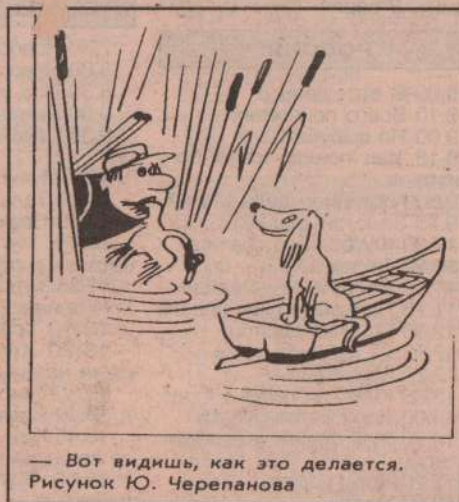
— Вот видишь, как это делается. Рисунок Ю. Черепанова

конечно, надо пресекать такие поступки. Даже утка летом не боится людей, не говоря уже о некоторых других птицах. И если бы каждый человек, в том числе охотник, относился к природе с любовью, то не было бы и Красной книги.