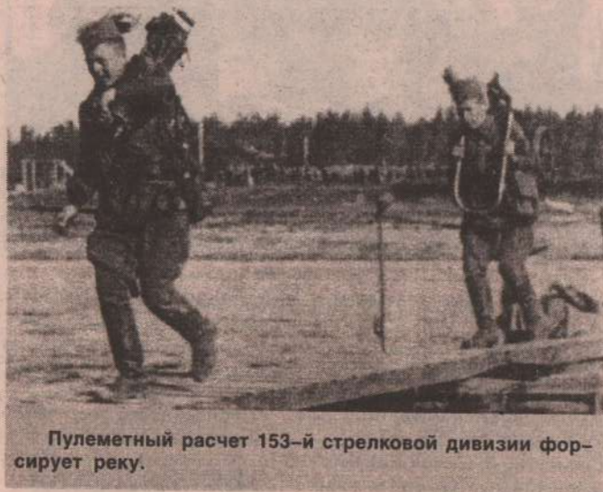
Пулеметный расчет 153-й стрелковой дивизии форсирует реку.

Один с простреленной рукой, Со шрамом на щеке другой. А третий скован гипсом. Он сам с собою говорит И зажигалку мастерит. Из пулеметной гильзы. Четвертый сушит самосад. Он десять дней тому назад Контужен при обстреле. Отвоевал. Ему — домой. Он жив. Но он глухонемой С тридцатого апреля.