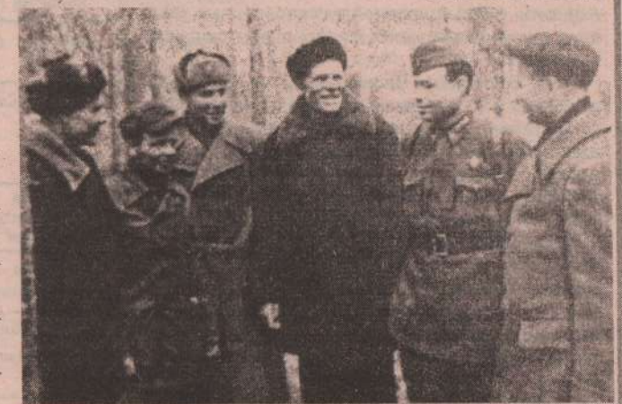
Делегация свердловских рабочих среди воинов 22-й армии.

ной ногой. Одной ногой... Одной ногой... Ведь не было другой. А юный, седой герой Стоял над плачущей сестрой, Твердя баском: «Ну вас, девчонок не поймешь. Чего ты, глупая, ревешь?» И мужественно всхлипнул. И завершился мрачный спор, И посрамленная карга Пустилась, охая, в бега Из этой круговерти. Да будет жизнь. И смерти нет. И даже тот увидит свет, Кто ужас тьмы изведал. Из куклы стянутой бинтом. Как бабочка, прорвался стон, Счастливый стон: «Победа!» Увы, не просто... С детских лет Учили нас, что Бога нет.