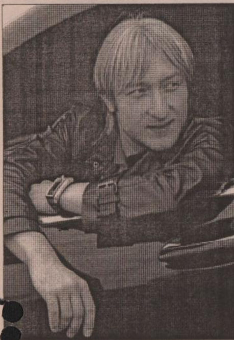
Взяв олимпийское «золото» в Турине, Евгений Плющенко решил не заикливаться на фигурном катании. Чемпион занялся гостиничным бизнесом, стал ведущим программы «Звезды на льду».

— В 24 года вас уже называют «гордость страны», «лицом России». Не поверю, что после таких громких комплиментов можно избежать головокружения от успехов.