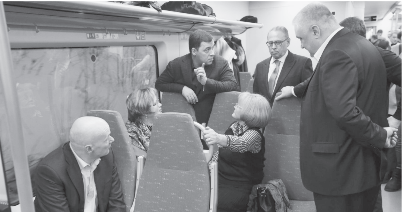
В январе 2016 года скоростной поезд «Ласточка» впервые начал курсировать между Екатеринбург и Кузино с остановкой в Первоуральске