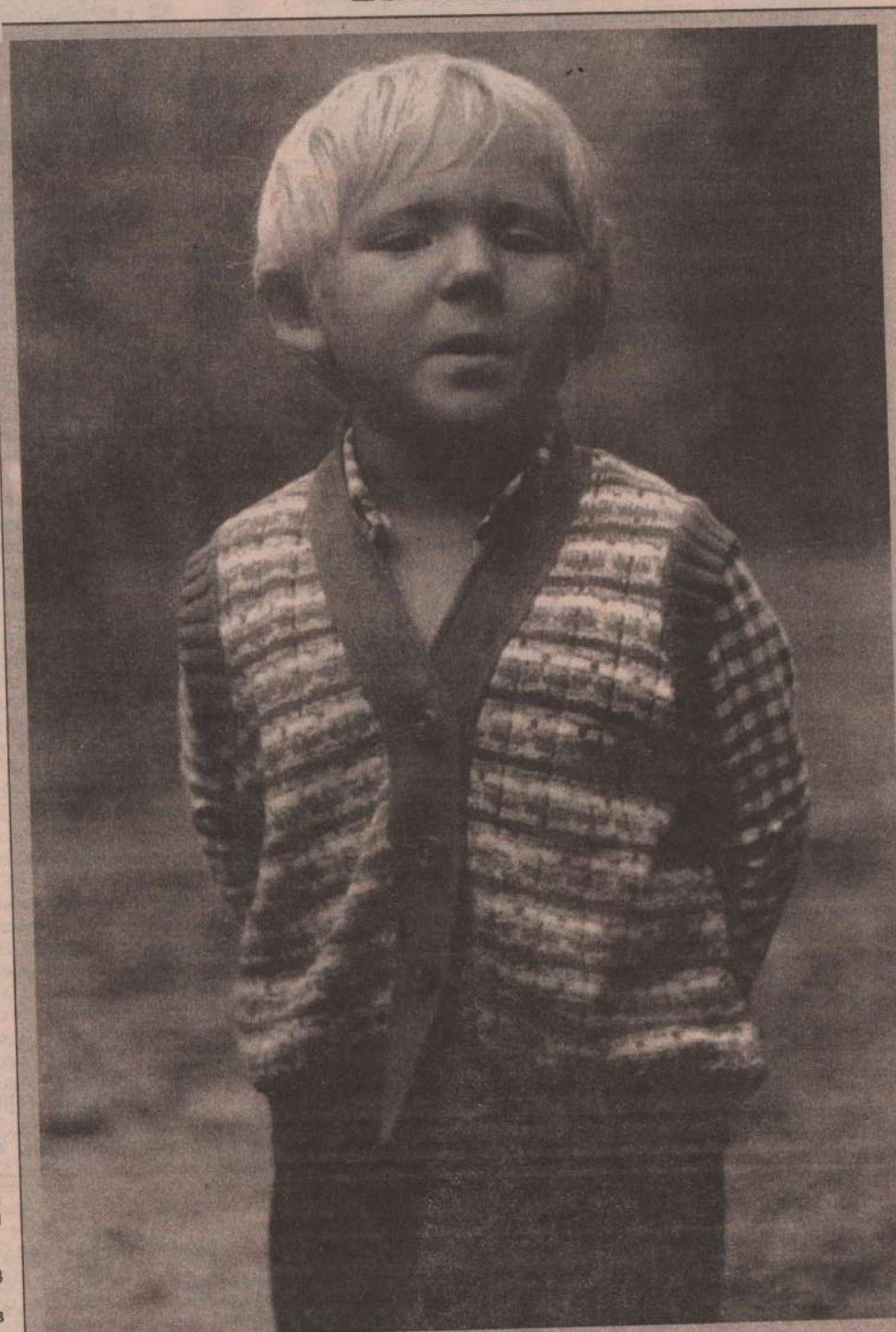
«ПЕРВЫЙ ПАРЕНЬ НА ДЕРЕВНЕ».

На остальные виды продовольственных товаров цены увеличились от 12% до 78%, в связи с ростом оптово-отпускных цен.