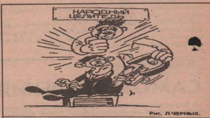
Рис. Л. ЧЕРНЫХ.