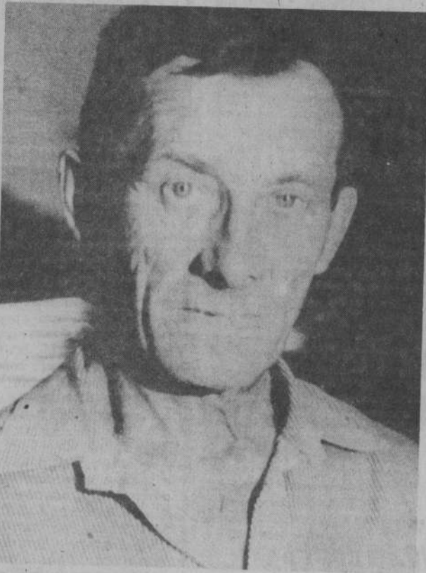
ИЗ РЕДАКЦИОННОЙ ПОЧТЫ