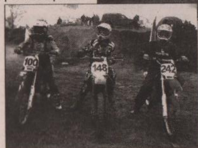
На гоночной трассе

а также должно быть отдельное место для мотоциклов». Юные гонщики учатся разбираться в технике, ведь без этого далеко не уедешь. Так что ребята не только поддерживают себя в форме, катаются на трассе, но и учатся ремонтировать своих «железных коней».