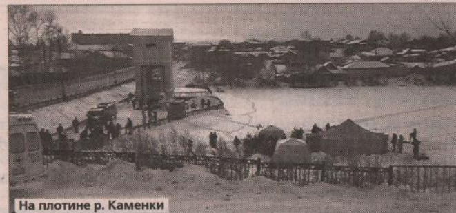
На плотине р. Каменки

По словам Н. Скляренко, в 2008 году преступлений в сфере санитарного благополучия населения выявлено не было, хотя административных правонарушений — 461, в том числе нарушение санитарного законодательства — 451, и нарушение правил обращения с отходами производства. Привлечены к административной ответственности 20 руководителей различных организаций.