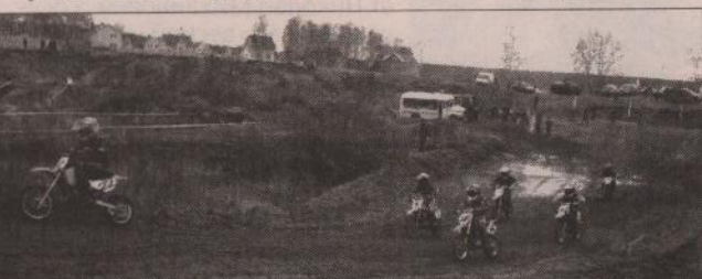
Наши юные гонщики