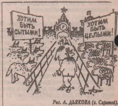
Рис. А. ДЬЯКОВА (г. Саратов).