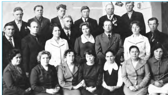
1976 г. Специалисты и передовики производства на районном празднике

В 1993 г. совхоз «Пироговский» был реорганизован в товарищество с ограниченной ответственностью акционерное общество закрытого типа. По постановле-