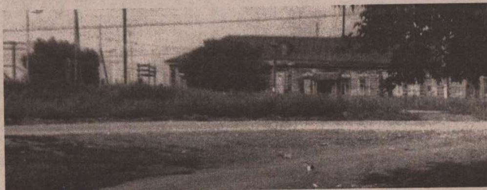
На снимке: старое здание райбыткомбината в с. Покровском.