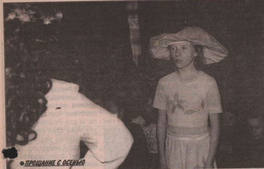
● ПРОЩАНИЕ С ОСЕНЬЮ

К Колчеданской школе-интернату многие родители относятся с предубеждением и опаской: боятся некоторые общения с детьми из неблагополучных семей, иные же того, что здесь обучаются педагогически запущенные и отстающие ученики.